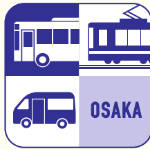
Osaka MaaS アプリ